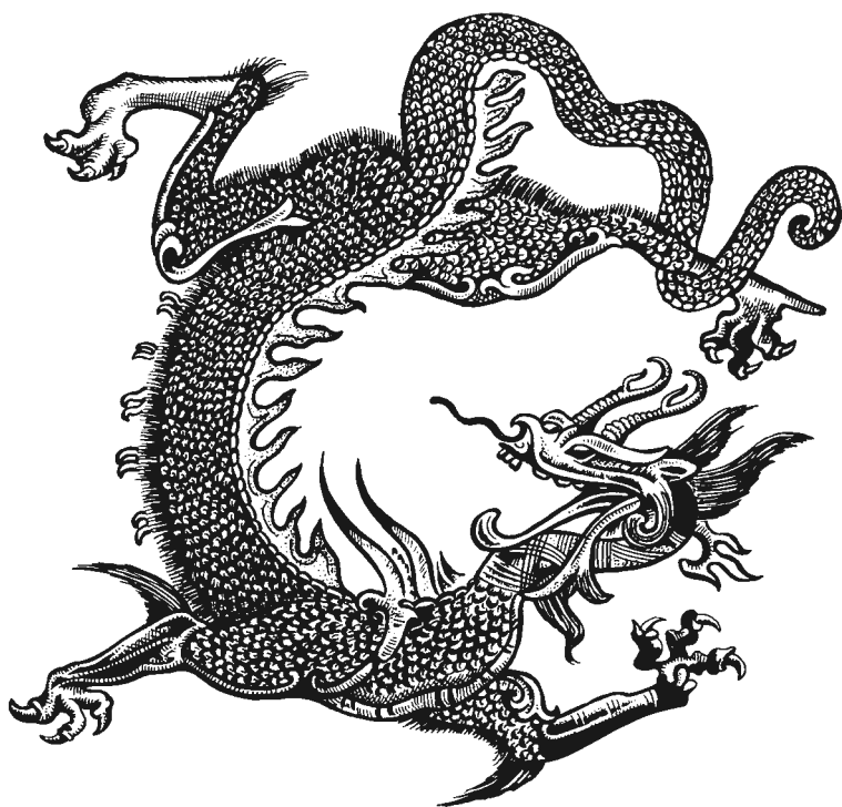
Obr. 2 Abychom alespoň částečně naznačili dovednost některých z Liou Anových hostí, kteří dokázali zkrotit draka nebo na něm dokonce jezdit, nabízíme tohoto tvora, jak je zobrazen na starověkém bronzovém zrcadle.

Jeden z nás se dokáže pohybovat prostorem a kráčet prázdnotou, umí vstoupit do moře a do blubiny, dovede projít jakoukoli překážkou a umí dýchat dechem tisíců míl.