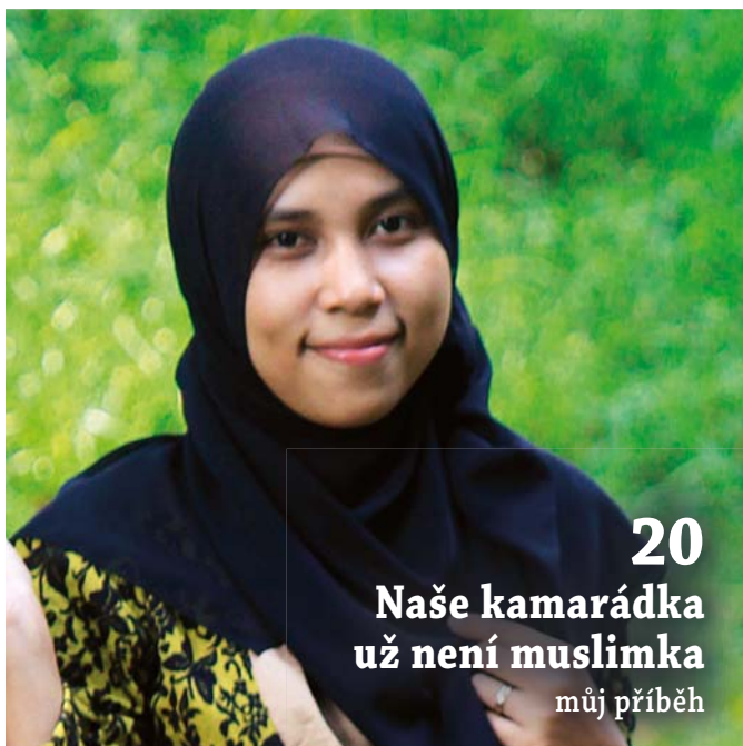
20 Naše kamarádka už není muslimka můj příběh