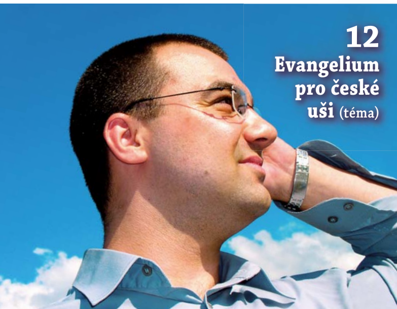
12 Evangelium pro české uši (téma)