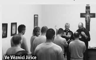
Ve Věznici Jiříce