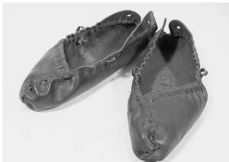
■ obrázek 4 Krpce s otevřenou patou a asymetrickým „nosem“ z Lopeníku na Moravských Kopicích.

Lýtka si u nižších typů obuvi lidé chránili hustým omotáním řemínků kolem nohy. Dá se říci, že tento způsob ochrany byl předchůdcem punčoch z vlněného materiálu, které jsou doloženy již od 12. století a pravděpodobně se na ně také vztahuje ruský výraz kopytce , známý od 11. století. Na Moravě a v Polsku se dosud používá pro vlněné ponožky, které se obouvají do krpců.