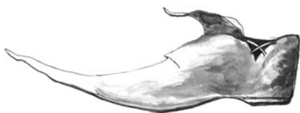
■ obrázek 5 Středověký typ zobcovité obuvi.

Středověk sice přinesl nové tvary a vzhled obuvi, ale v technologii výroby žádná větší změna nenastala. Tak, jako se v této době obecně zanedbávala péče o tělo a hygiena, nebral se zřetel ani na anatomii a funkčnost obouvání. Tvar obuvi nabývá velmi roztočivých, až bizarních podob. V době křížáckých výprav, ve 12. – 13. století, se v Evropě začíná projevovat vliv Orientu, který vrcholí v přehnaně špičatých tzv. zobákovitých střevicích , charakteristických především pro gotické období. Ve Francii dostaly pojmenování poulaine a prosadily se všude, kde vládla burgundská móda. Byly pestré jako tehdejší oblečení a jejich špičky měřily někdy až dvakrát více než sama podrážka; aby se v nich vůbec dalo chodit, musely se špičky přivazovat řetízky pod kolena. Zobce byly často zdobeny rolničkami. V takové obuvi byla chůze téměř akrobacií, a její majitelé se také pěšky pohybovali co nejméně – jezdili na koních a v kočárech. U nás se tato móda rozšířila hlavně ve 14. – 15. století. V této době se vyrábí obuv symetrická, na obě nohy stejná, je rovná, bez podpatků.