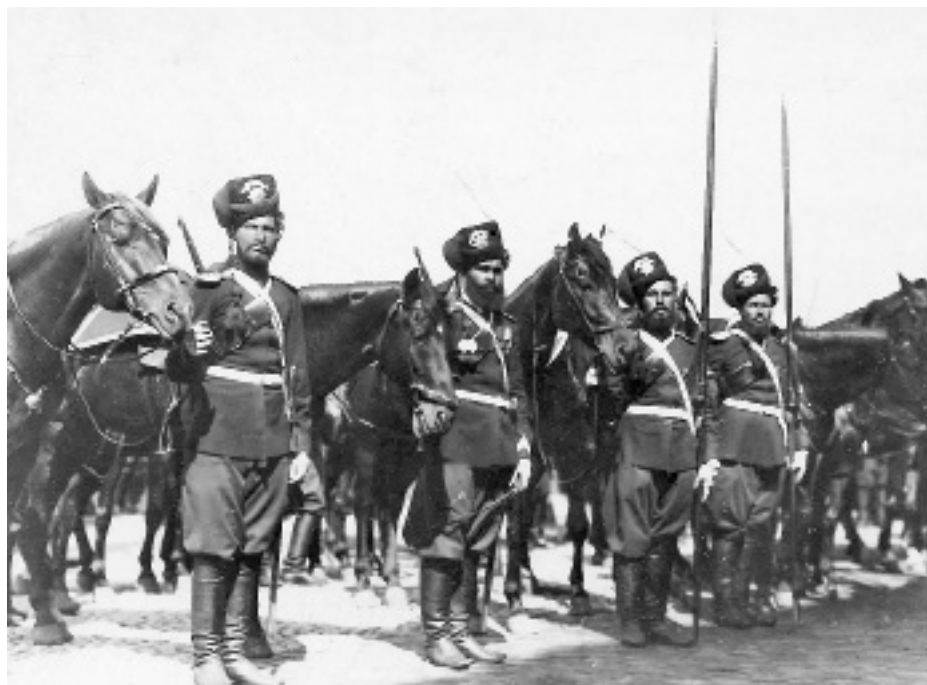
Kozáci v Petrohradě, rok 1914.

temných postav, aby se přesvědčil, neponechal-li si některý z nás snad zbraně. Za několik okamžiků smýkala se řada zajatců jako dlouhý šedý had měsíční nocí k můstku, vedoucímu přes Malou Strypu, do ruského zajetí. Byl jsem „pleníkem“ – válečným zajatcem Rusů, našich velikých bratří, o nichž jsme snili a jejichž život do nedávna byl nám pohádkou. Země jejich připadala nám říší obrů, kteří snad se přece někdy rozpomenou na malého, trpícího bratra tam v dále na západě, zmítajícího a dusícího se pod hrubou botou cizáckého císaře, a přijdou jej osvobodit.