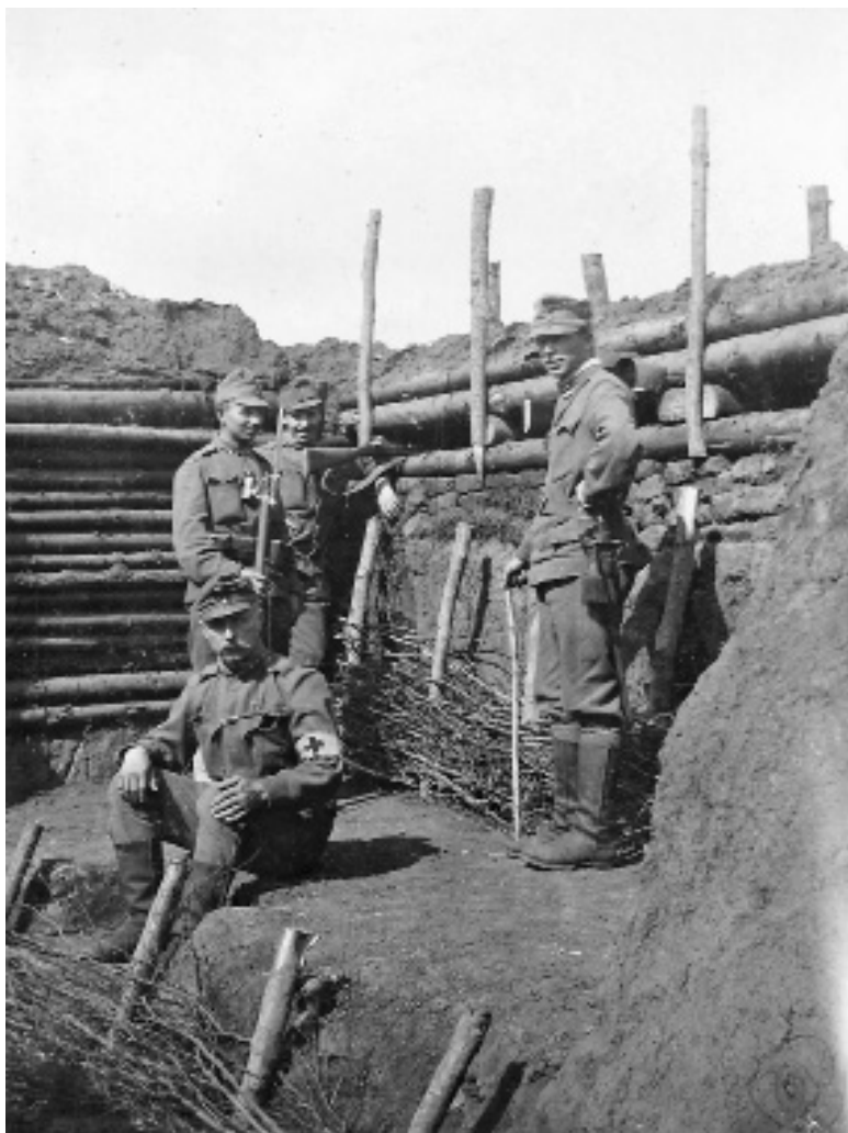
Rakousko-uherské zákopy v Haliči, rok 1915.

Neznám druhého člověka na světě, s nímž by si byl ve světové válce osud tak zahrával jako právě se mnou. Což nevidíte v tom řízení osudu, byl-li jsem v tentýž den povýšen na c. k. frajtra, kdy generál Hindenburg na maršála? Nu, co tomu, prosím, říkáte? Nezdá se vám to hodně podivné? Tak vidíte! Já na tu ohromnou náhodu již tenkrát kdekoho upozorňoval a nutil lidi, aby se nad tím pozastavili a zamyslili, bohužel, marně. Zlí jazykové stihli mne proto naopak ještě posměchem, tropíce si z mé hodnosti nemístné žerty. Říkali, že prý my dva, totiž já a Hindenburg už to výš nepřivedem. A prosím, ať se dnes všichni ti posměváčkové popadnou za nos, jak se šeredně mýlili! Ti, kteří táhli se