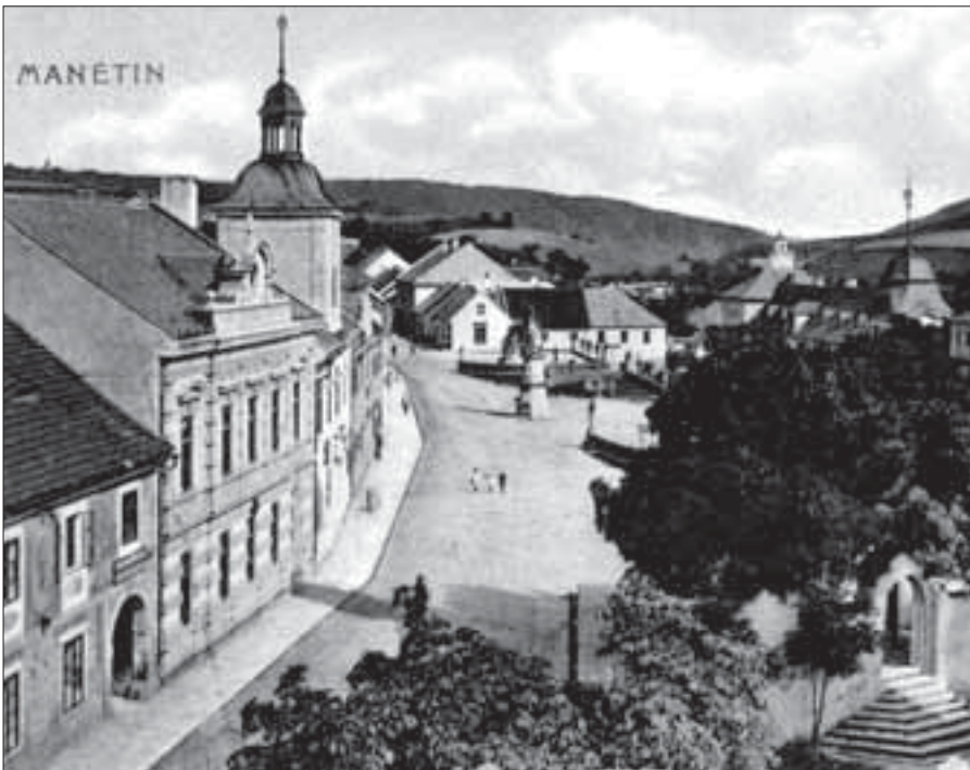
Manětín v první polovině 20. století