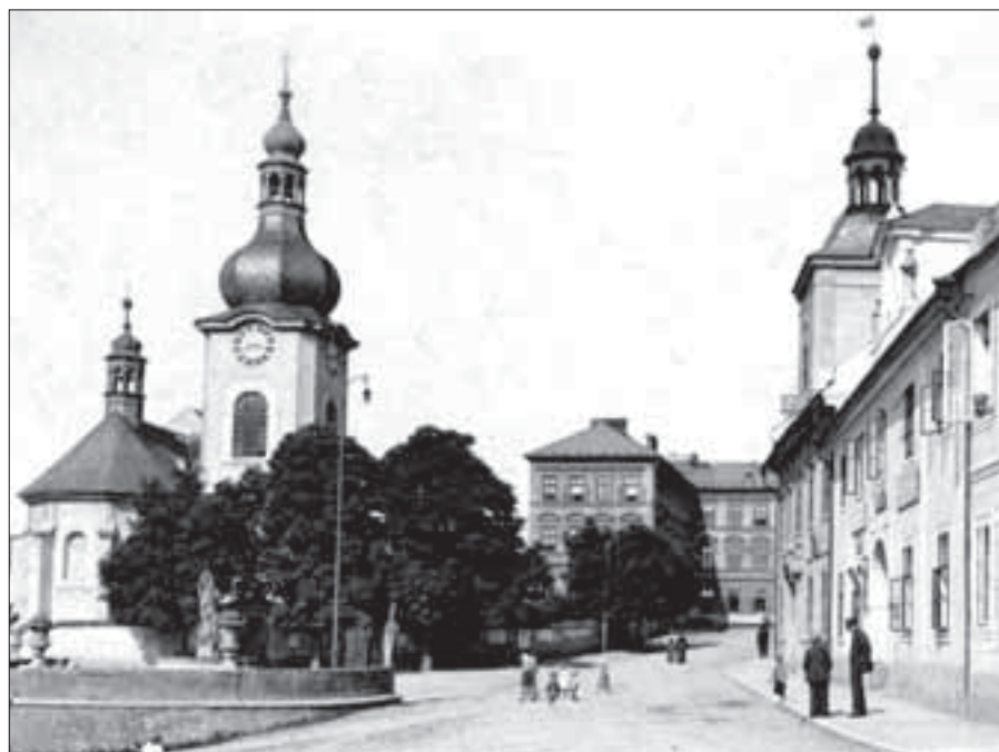
Manětín v první polovině 20. století