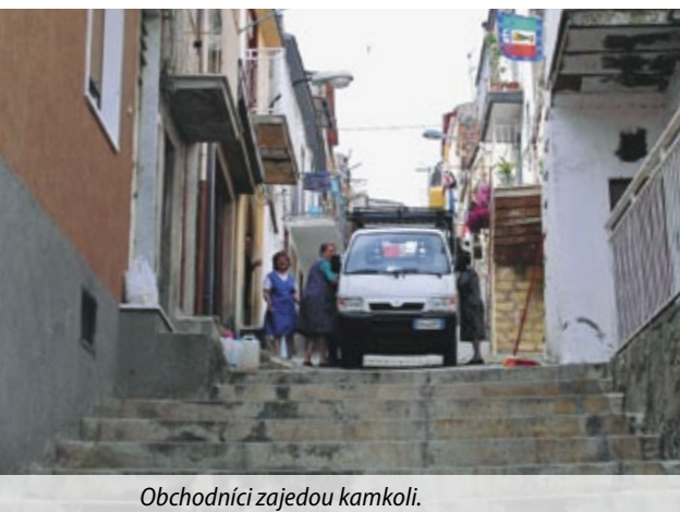
Obchodníci zajedou kamkoli.

Ráno zase spáče probudí ohlašování podomních obchodníků, kteří mají sortiment i hodiny řádně rozděleny. V osm vás probudí chleba, který se zásadně ohlašuje troubením, ale zato nepřeslechnutelným. O půl hodiny později zelenina, pak se již pravidelně střídají rybárna, drogerie, domácí potřeby, koberce a matrace a někdy kolem poledního to završí zmrzlina. Starší generace pojezdících obchodníků používá tradiční zpěvavý způsob nabídky, který je pro jih Itálie typický a po generace neměnný.