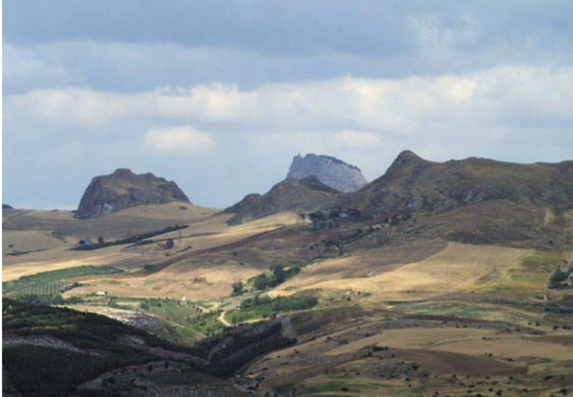
Sicilská krajina je úchvatná.

zítra – domani , což je další hodně frekventované slovo. A zítra je to zase zítra a nakonec netrpělivý Středoevropan zařídí věc svépomocí. Musíte ovšem počítat s tím, že vaše netrpělivá činnost bude po celou dobu doprovázena nechápajícím kroutěním hlavou přihlízejících, v některých případech se může objevit i výmluvné gesto poplácání otevřenou dlaní o čelo.