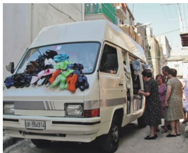
Obchodník s obuví má vždycky úspěch.

Když vám takový zelinářský chlapík po ránu zazpívá, že veze brambory krááááásnééé, má to své kouzlo a rádi mu odpustíte, že vás o dovolené tak brzo budí. Pokud si chcete odpočinout, nejlepší čas je od jedné do čtyř, což je čas siesty, která je svatá. Ačkoli náš denní rytmus je diametrálně odlišný a zpočátku každý s těmito třemi hodinami nehybnosti bojuje, nakonec je zapotřebí Sicilanům přiznat, že vědí, co dělají.